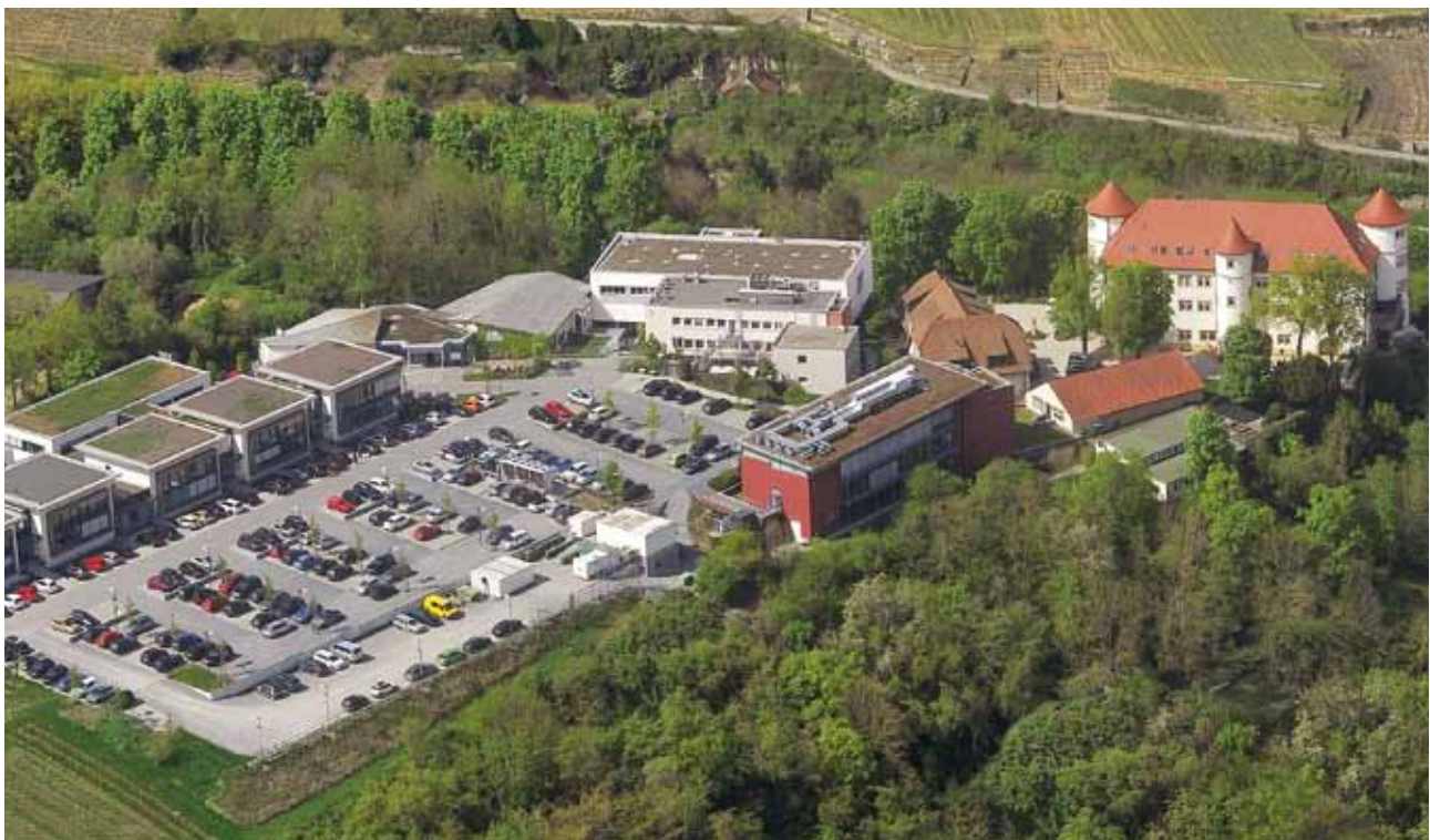
Die Hohenstein Institute